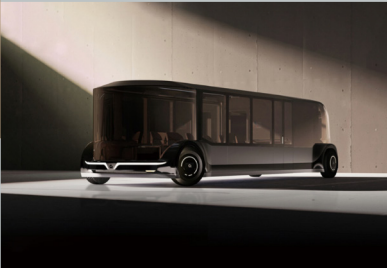
제58회 대한민국디자인전람회 일반 및 대학생 부문 동상(특허청장상) 수상작 레드