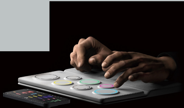
제58회 대한민국디자인전람회 일반 및 대학생 부문 은상(산업통상자원부장관상) 수상작 바이브라