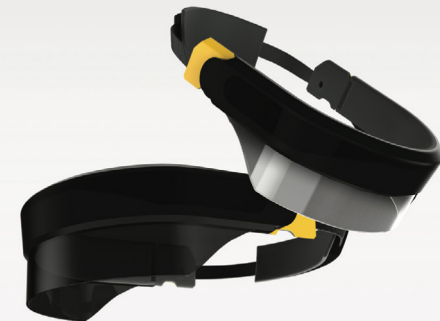
제58회 대한민국디자인전람회 일반 및 대학생 부문 동상(한국디자인진흥원장상) 수상작 스마트 물류 서비스, 플리드